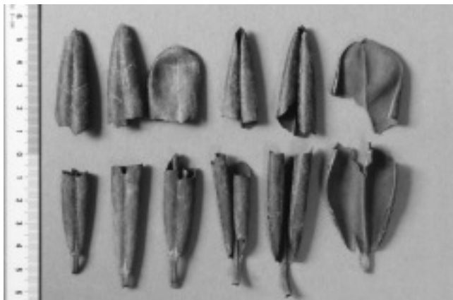
写真1 患者宅から回収されたシャクナゲの葉

わが国の江戸時代の本草書『本草綱目啓蒙』などでは石南にシャクナゲ類を充て 11,12) 、アズマシャクナゲ、ハクサンシャクナゲ、ツクシシャクナゲ、ホンシャクナゲなどの乾燥した葉を石南葉と称してきた 11,13) 。民間で利尿薬としてリウマチ、痛風などに用いられるが、飲み過ぎると痙攣