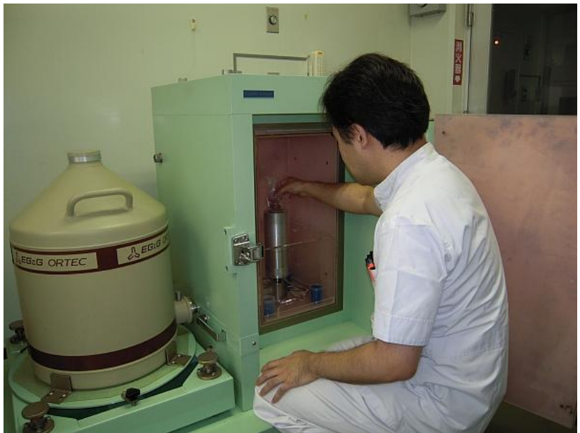
試料をゲルマニウム半導体検出器にセット