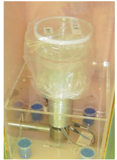
マリネリ容器を 測定装置にセット