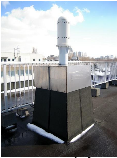
モニタリングポスト (空間放射線量率)