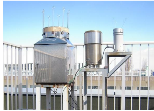
定時降下物採集装置(日間) 直径 30cm