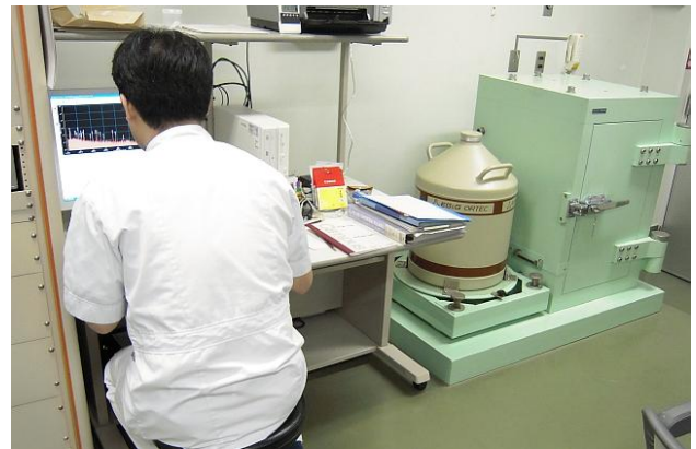
ゲルマニウム半導体検出器 による放射能の測定