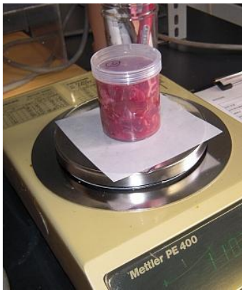
試料を測定用U8 容器に入れて秤量