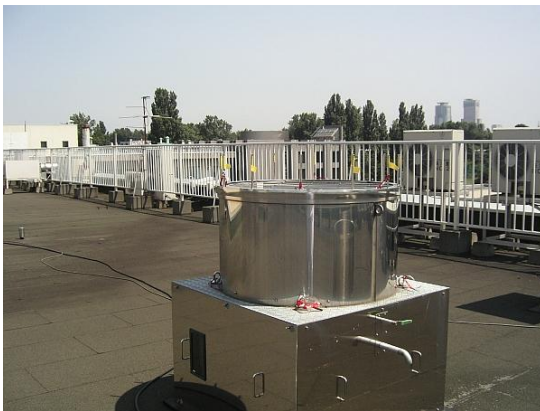
降下物採集装置(月間) 直径 80cm