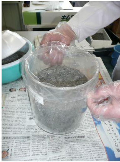
イカナゴを マリネリ容器に 入れたところ